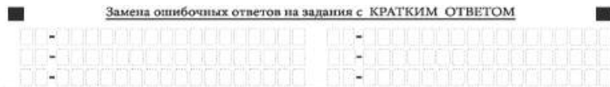
Рис. 10. Нижняя часть бланка ответов № 1 (поле замены ошибочных ответов на задания с кратким ответом)

Для замены ответа, внесенного в бланк ответов № 1, нужно в поле «Замена ошибочных ответов на задания с КРАТКИМ ОТВЕТОМ» указать номер задания (две первых клеточки перед знаком тире), ответ на который следует исправить. Номера заданий от 1 до 9 необходимо указывать, начиная с первой клетки (например, 1, 2, 3 ...), вторая клетка остается незаполненной. В поле для исправленного ответа (17 клеточек после знака тире) записать новое значение верного ответа на указанное задание.